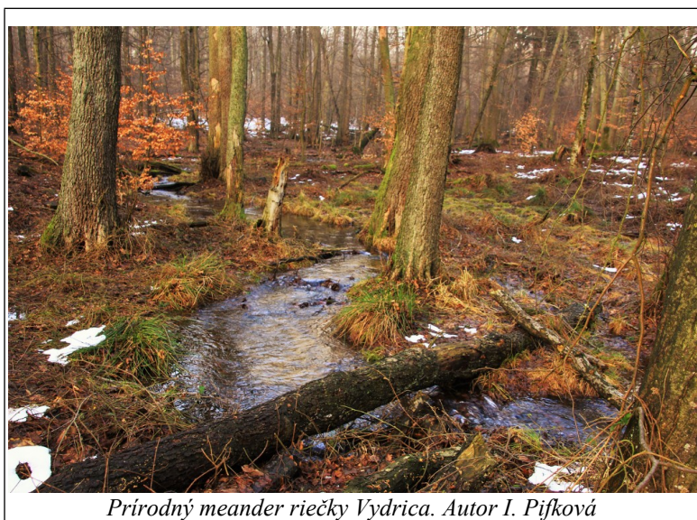
Prírodný meander riečky Vydrica.

Bratislavským lesoparkom preteká riečka Vydrica, ktorá si ako jedna z mála tokov zachovala prirodzené koryto a pôvodnú morfológiu v podobe meandrov, ako aj spoločenstvá rastlín a živočíchov typických pre nivy. Na jej toku sa nachádzajú 3 územia európskeho významu chránené v sústave Natura 2000. Je jednou z mála lokalít výskytu raka riavového na Slovensku. V povodí toku môžeme nájsť aj ďalšie vzácne živočíchov ako sú salamandra škvrnitá, fúzač alpský, kováčik fialový či vtáky tesár čierny, ďateľ prostredný, bocian čierny, myšiak lesný a mnoho ďalších.